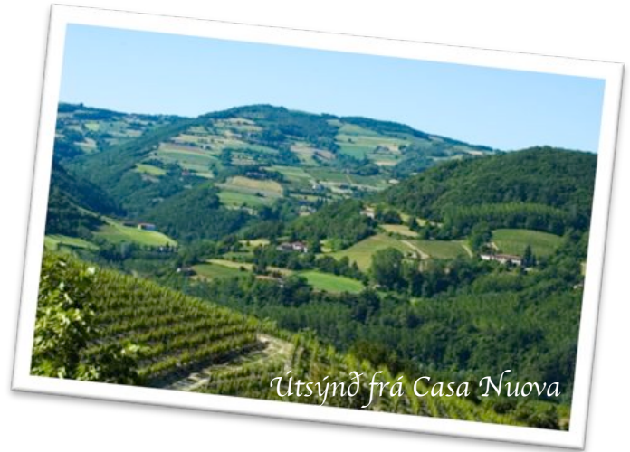
Útsýnd frá Casa Nuova

Um botn Bormida dalsins rennur Bormida áin. Við austur enda dalsins er Acqui Terme, þar sem er að finna heitar uppsepprettur, gömul rómverks böð og vatnsveitu. Í vestur hlikkjast vegurinn inn dalinn, í gengum Bubbio og síðan til Loazole og Cessole, og haldi maður enn lengra, yfir fjöllin til Alba. Norðan við hæðina sem Casa Nuova stendur í tekur við Monferrato, með bæjum eins og Canelli og Nizza Monferrato. Sá fyrri er heimabær Asti freiðivinsins og sá síðari er miðstöð Barbera vinsins.